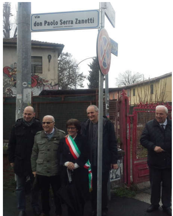
La presenza dell'Arcivescovo Matteo Zuppi

(nel sito dell'associazione www.donpaolino.it il testo della memoria e le foto della cerimonia)